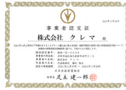
グリーン購入法に係る合法性・持続可能性の証明に係る事業者にも認定されています