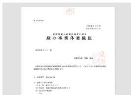
京都府木材認証制度に係る緑の事業者登録