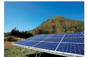
SDGsの一環事業として、和歌山県西牟婁郡すさみ町で、2015年11月より太陽光発電事業を行っています