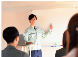
商社だから多彩なスキル&キャリアを身につけられます