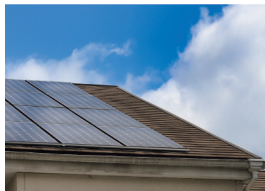
長期優良住宅やZEH住宅といった省エネ住宅のご提案をしております